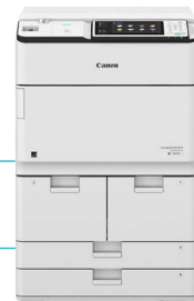
IR ADV 6555i PRT