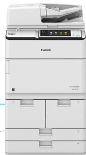
IR ADV 6575i/6565i/6555i